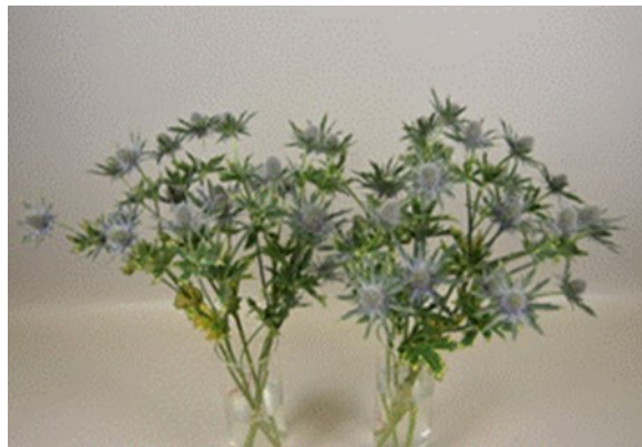
Eryngium 'Orion' – Dag 14