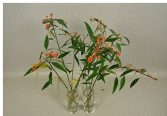
Euphorbia fulgens 'Orange Queen' – Dag 7