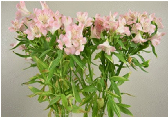
Alstroemeria 'Wonder Sweet' – Dag 18