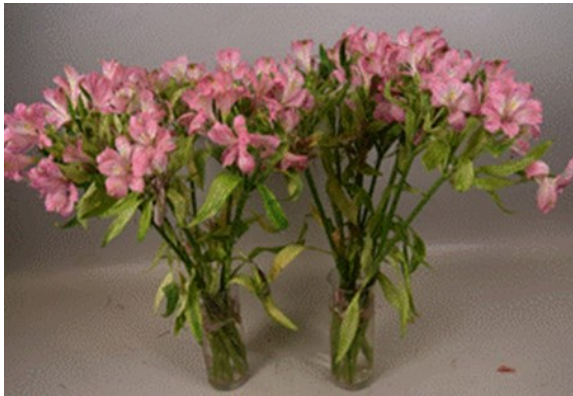
Alstroemeria 'Posh Pink' – Dag 14