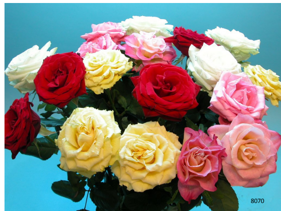
Traitement: Chrysal Clear nourriture pour roses poudre Durée de vie en vase totale: 19 jours Photo prise: jour 15