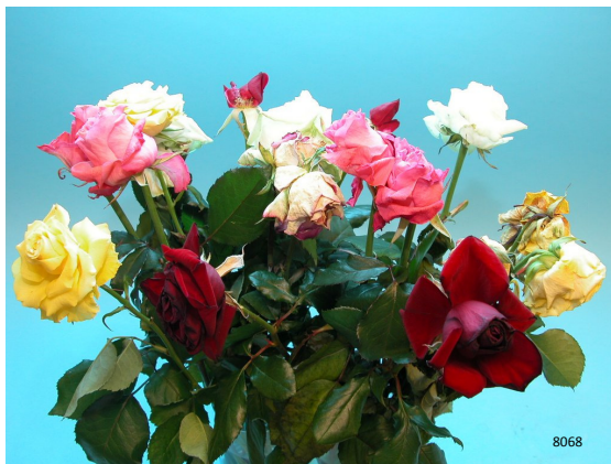
Traitement: eau Durée de vie en vase totale: 8 jours Photo prise: jour 15